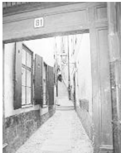
Left: Old Town, Stockholm