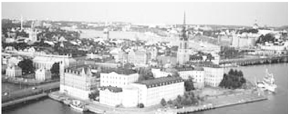
The City of Stockholm is part of a large archipelago of 24,000 islands. To the left is a view of one of the many islands that are part of