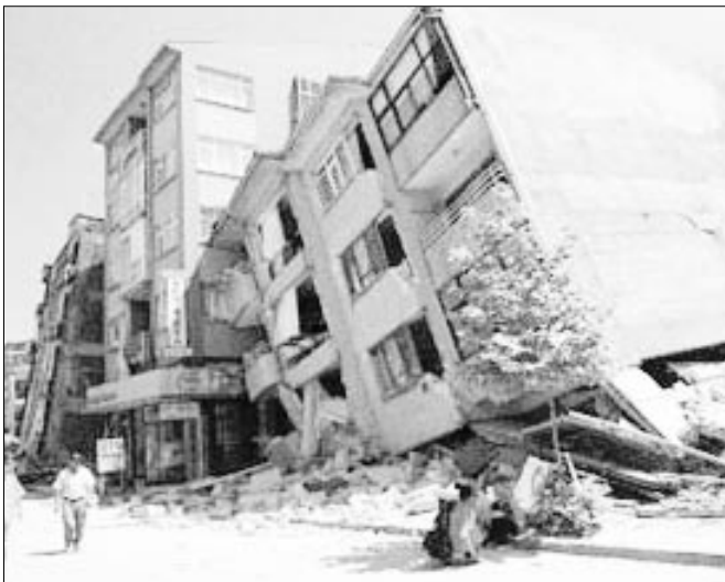
Photographs of earthquake damage in Turkey. Above: Ground level failure to apartment house. Right: Highway bridge failure.