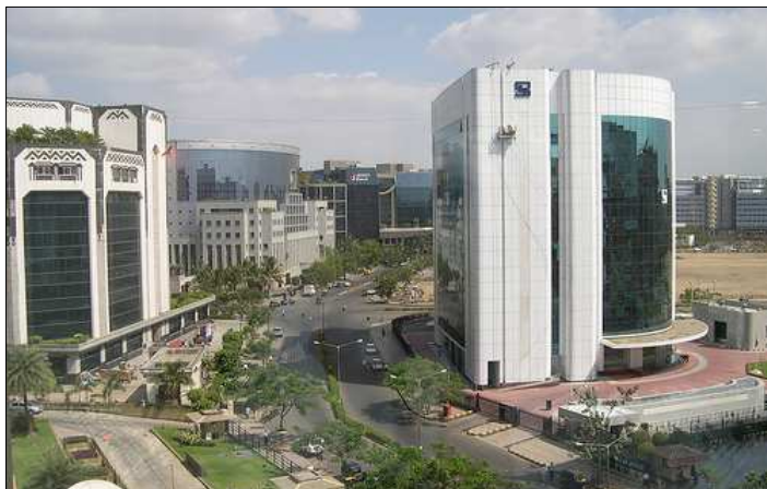
Nuevas oficinas en el complejo Bandra-Kurla en el sector norte de Dharavi

Los residentes de Dharavi han hecho claro que acogen con agrado la necesidad de una reurbanización. También aceptan que para compensar el alto costo de reurbanización nuevos desarrollos de vivienda y de locales comerciales tendrían que venderse a precio del mercado. Pero su exigencia prioritaria es que a todo nivel del diseño del proyecto y de su implementación, la gente de Dharavi esté completamente involucrada. Los residentes insisten que los pequeños barrios vecindarios deben respetarse y que los comercios locales y modos de ganarse la vida sean integradas al nuevo desarrollo.