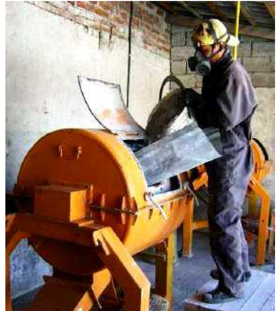
خط الجير والبوزولانا في محطة أبحاث سانتا كلارا كوبا